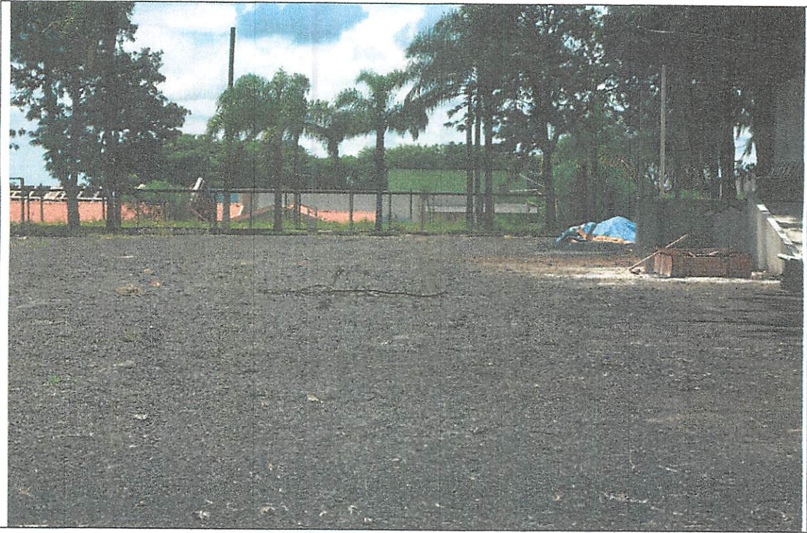
- situação do pátio de formatura e atividades -